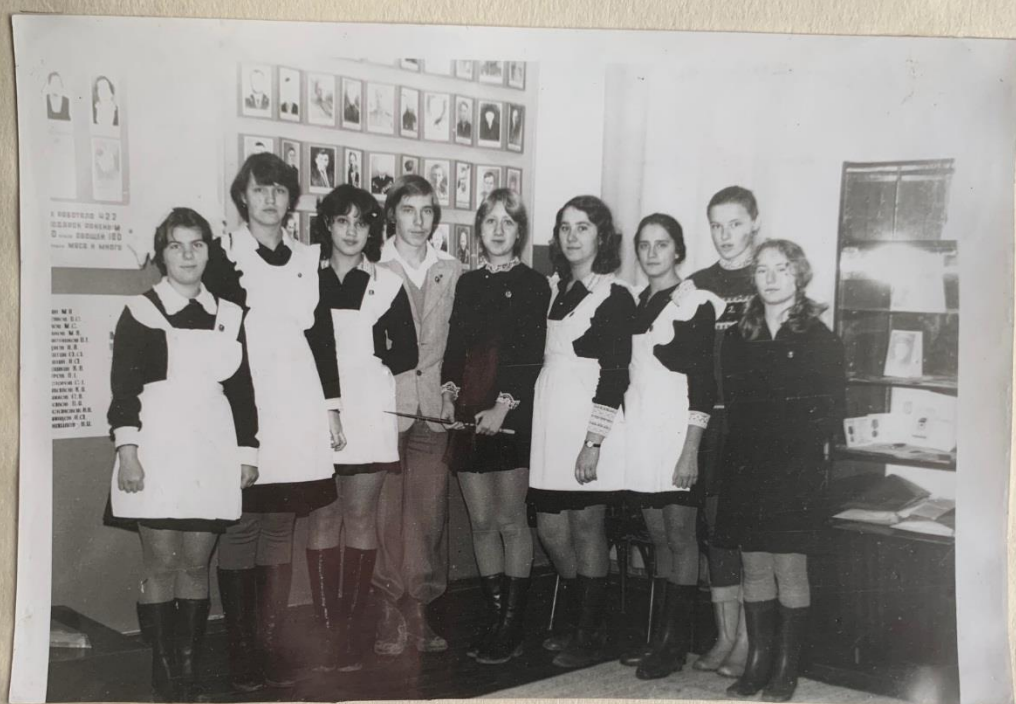
ЛЕКТОРСКАЯ ГРУППА УЧАЩИХСЯ КЛУБА „ПОИСК“