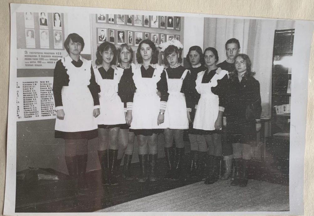
ГРУППА УЧАЩИХСЯ УЧЕТА КЛУБА „ ПОИСК“