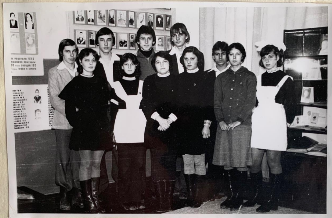
ПОИСКОВАЯ ГРУППА КЛУБА „ПОИСК“

сбору, систематизации, оформлению экспозиции.